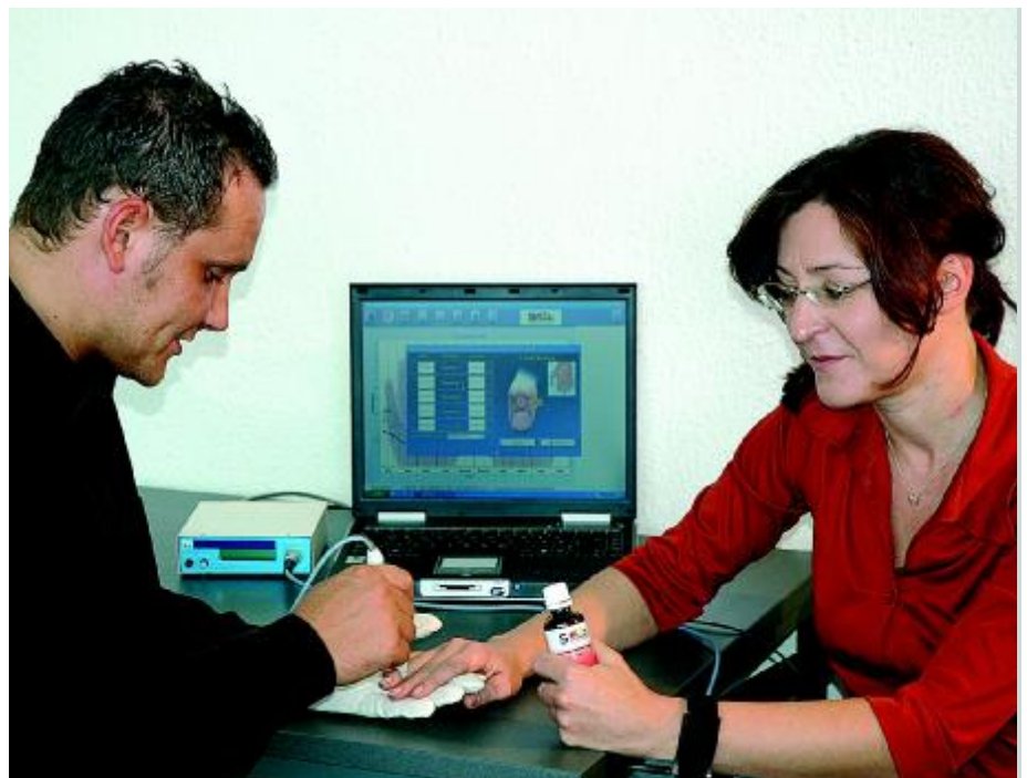
Abb. 1: Mit dem Vitalpunkt-Energiecheck kann die Seyromis-Essenz bestimmt werden, die die energetische Ausgangssituation am besten beeinflusst.

Ziel der SEYROMIS-Essenzen ist die Wiederherstellung des seelischen Gleichgewichts durch eine Harmonisierung von destruktiven seelischen Verhaltensmustern. Im Idealfall decken die Essenzen den Weg zu den eigenen seelischen Selbstheilungskräften auf. Hier sehen die SEYROMIS-Macher Parallelen zur Sa-