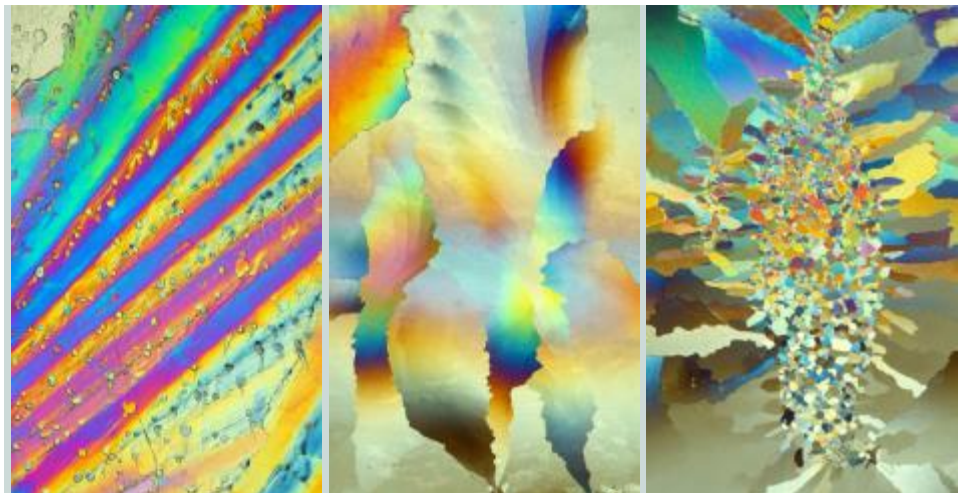
Der Fotograf Günther Schön hat die die unterschiedlichen Schwingungsmuster der SEYROMIS-Essenzen in so genannten Schwingungsbildern festgehalten. Hier die Essenzen (von links nach rechts) Nr. 1, 2, 3.

jährige Erfahrungen in der Energiearbeit, sie schöpft seit Jahren Kraft aus der Meditation. Während solcher meditativen Sitzungen hat sie schon einige Gedanken gefasst, die sie auch als Botschaften bezeichnet: Es drängt sie, diese Gedanken niederzuschreiben. Für sie sind es Botschaften einer höheren Kraft, die an sie weitergegeben werden. Anfangs war sie erstaunt und fragte sich skeptisch, was da mit ihr passierte. Heute nimmt sie diese Botschaften mit Freude an.