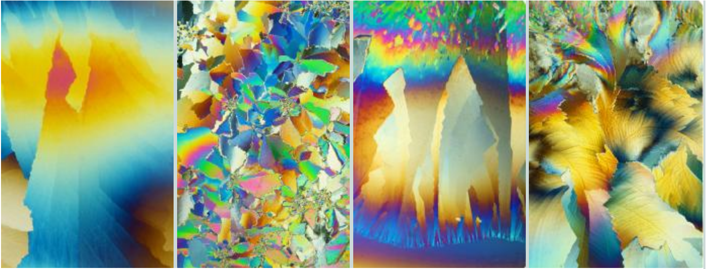
Dies sind die Schwingungsmuster der SEYROMIS-Essenzen (von links nach rechts) Nr. 4, 5, 6 und 7